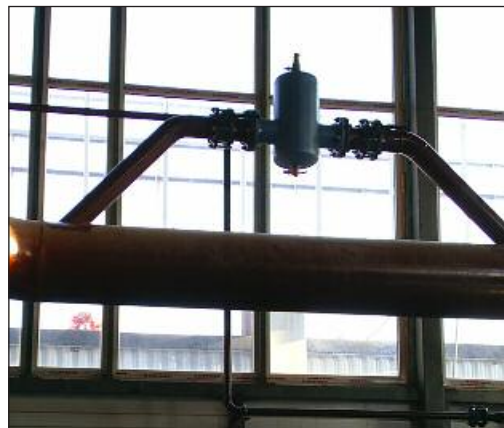
Рис. 7. Сепаратор воздуха Zeraro ZIO 150 F

пании «Пневматекс» (рис. 7). В данном случае сепаратор, смонтированный на байпасе обратной линии основной магистрали, обрабатывает только 10–20 % потока. Однако учитывая циркуляционный характер работы сепараторов, такая схема позволяет в стационарном режиме удалять пробки и газы из всей системы.