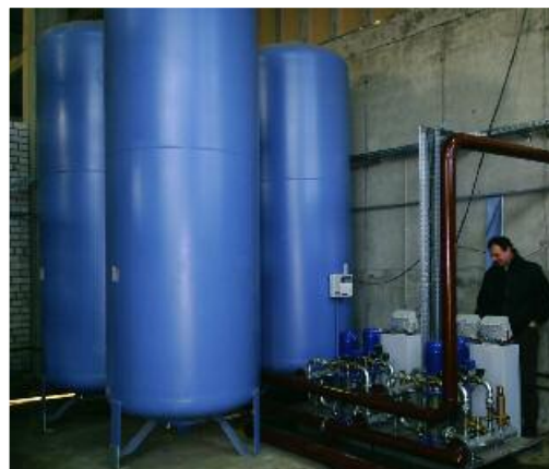
Рис. 3. Установка Transfero с баками TGI

Для быстрой дегазации системы в котельной был установлен сепаратор Zeparo ZIO 150 F ком-