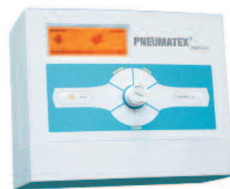
Рис. 5. Блок управления BrainCube