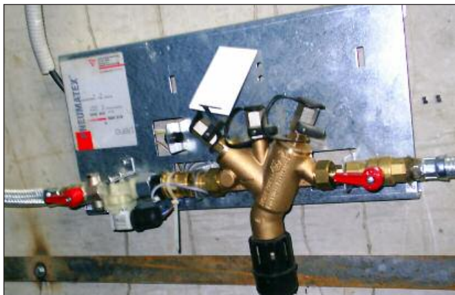
Рис. 6. Блок подпитки Pleno-P