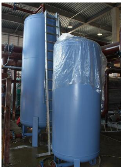
Рис. 4. Промежуточный и аккумуляторный баки