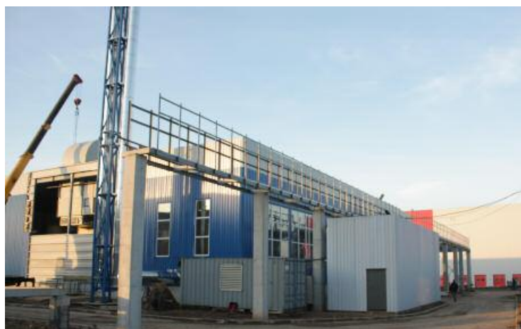
Рис. 1. Котельная

Для поддержания давления в системе была предложена станция Transfero производства компании «Пневматекс» (Швейцария), в данном случае состоящая из двух функциональных блоков TI 82.2, четырех расширительных баков TGI 5000 объемом 5000 л каждый, аккумуляторного бака AG 2000.10 и промежуточного бака DG 5000.10 (рис. 2, 3, 4). В состав установки также входит блок подпитки Pleno P.